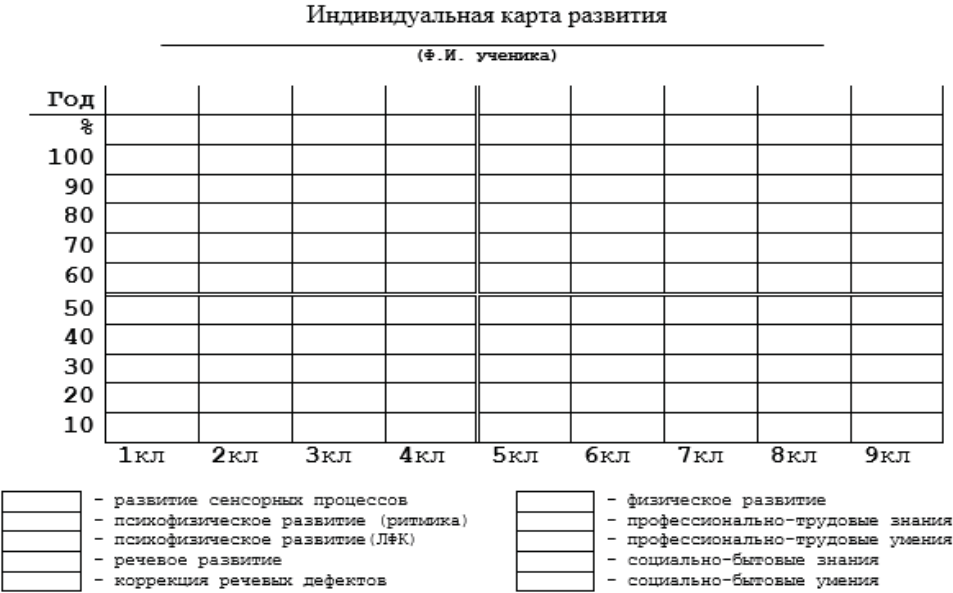
Рис. 1. Индивидуальная карта развития учащихся.