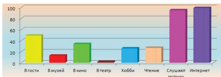
Рис. 2. Досуг обучающихся Центра образования

Учитывая негативные факторы городской среды, Служба комплексного психолого–педагогического сопровождения обучающихся Центра образования № 80 стремится приобщить подростков к разнообразным позитивным социальным действиям через игровую, творческую деятельность, создаёт обстановку подлинного сотрудничества, содружества, сотворчества, что способствует самораскрытию обучающихся.