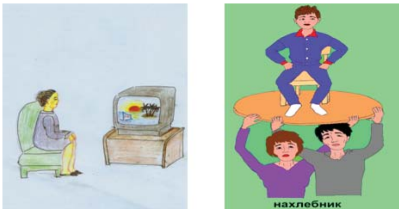
Рис.2. Зритель и нахлебник

В реализации ФГОС, из стен школы должен выходить, выпускник, овладевший личностным результатом: сформированной основой российской гражданской идентичности, с чувством гордости за свою Родину, российский народ и историю России, сформированной ценностью многонационального российского общества. Воспитательная программа «Деревце познаний» позволяет расширять знания учащихся, развивать творческие способности, приобретать опыт позитивного общения со сверстниками, старшими товарищами, учителями. Игра имеет роль в формировании успешного человека. Сейчас время успешных людей. Преуспевают люди совершенно иного склада – те, кто умеют четко поставить задачу, ограничить её и найти для неё решение. Причём эти задачи связаны с поведением других людей. Программа «Деревце познаний» учит детей жить среди людей, иметь цель и достигнуть её. Это и успех.