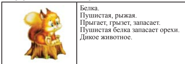
Страничка из альбома

К концу года у каждого ребенка набирается целый альбом с нерифмованными стихами, которые мы совместно оформляем с детьми и родителями.