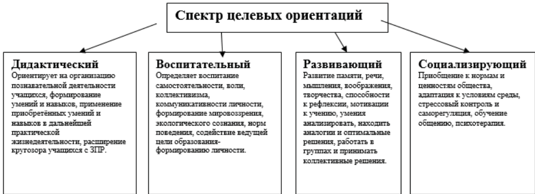
Схема 2. Целевые ориентации дидактических игр

Только в игре ребёнок может лучше самовыразиться – проявить себя, самоутвердиться, познать себя и других, чтобы особый ребёнок мог ощутить психологическую безопасность. Для осуществления интегрированного воспитания и инклюзивного обучения необходимо у детей с первых дней в школе строить взаимодействия на основе сотрудничества и взаимопонимания.