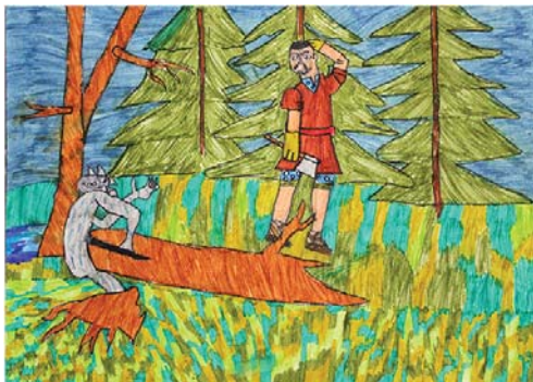
Рис. 5. Закиров Ислам (10 лет)