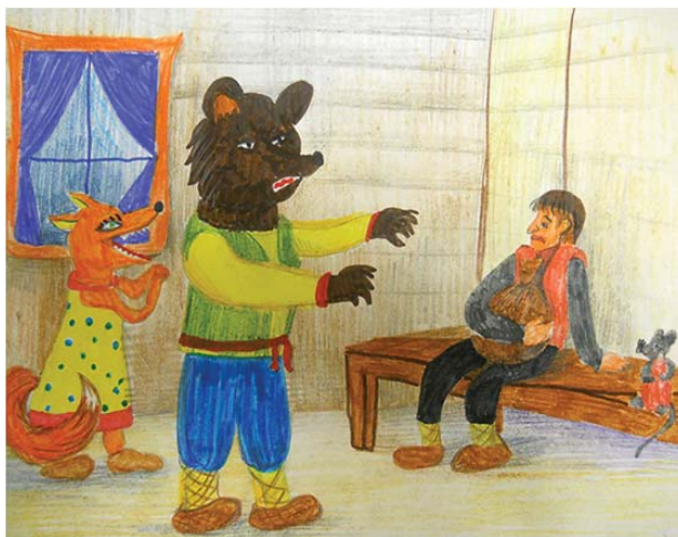
Рис. 2. Сулейманова Элина (12 лет)