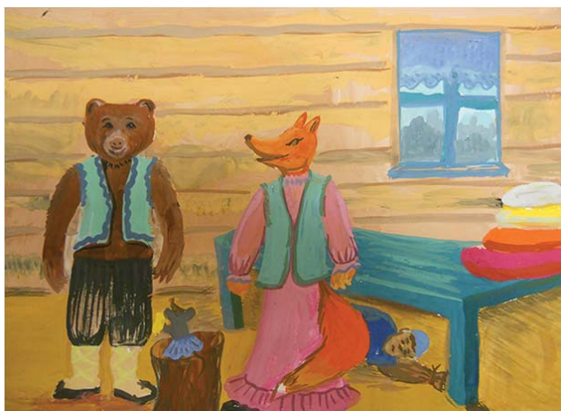
Рис. 1. Нигматуллина Азалия (11 лет)

Иллюстрации к татарской народной сказке «Саран и Юмарт» (рис. 1,2,3,4)