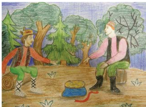
Рис. 3. Наумова Наташа (12 лет)