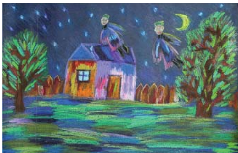
Рис. 6. Салахова Алина (9 лет)