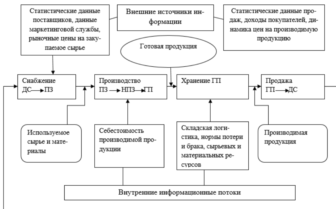
Рис. 2. Основные информационные потоки анализа финансово-хозяйственной деятельности организации при производственном процессе