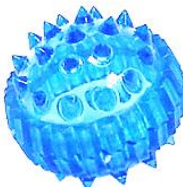
Рис. 1. Шарик-каштан Су-Джок

Внутри каждого шарика находится колечко (рисунок 2), которое необходимо надевать на каждый палец до легкого покраснения.