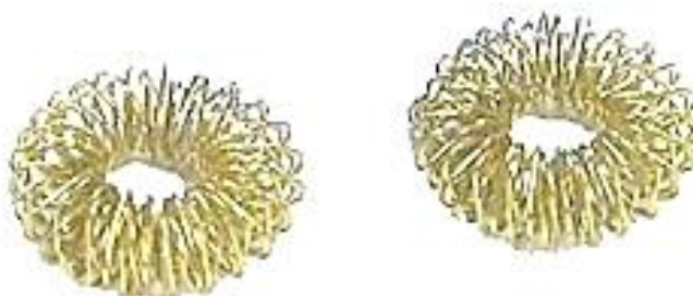
Рис. 2. Колечко Су-Джок

Внутри каждого шарика находится колечко (рисунок 2), которое необходимо надевать на каждый палец до легкого покраснения.