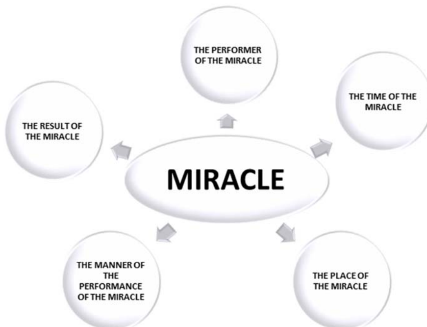
Рисунок 2. Фреймовая структура концепта «Miracle»

Каждый из данных фреймов распадается на некоторое количество слотов. Структурно-фреймовый концепт «Miracle» может быть представлен следующим образом: