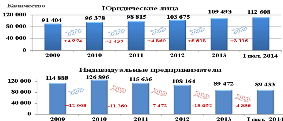
Рис. 1. Количество зарегистрированных налогоплательщиков на территории Республики Татарстан [1]

Сокращение количества индивидуальных предпринимателей обусловлено следующими основными причинами: