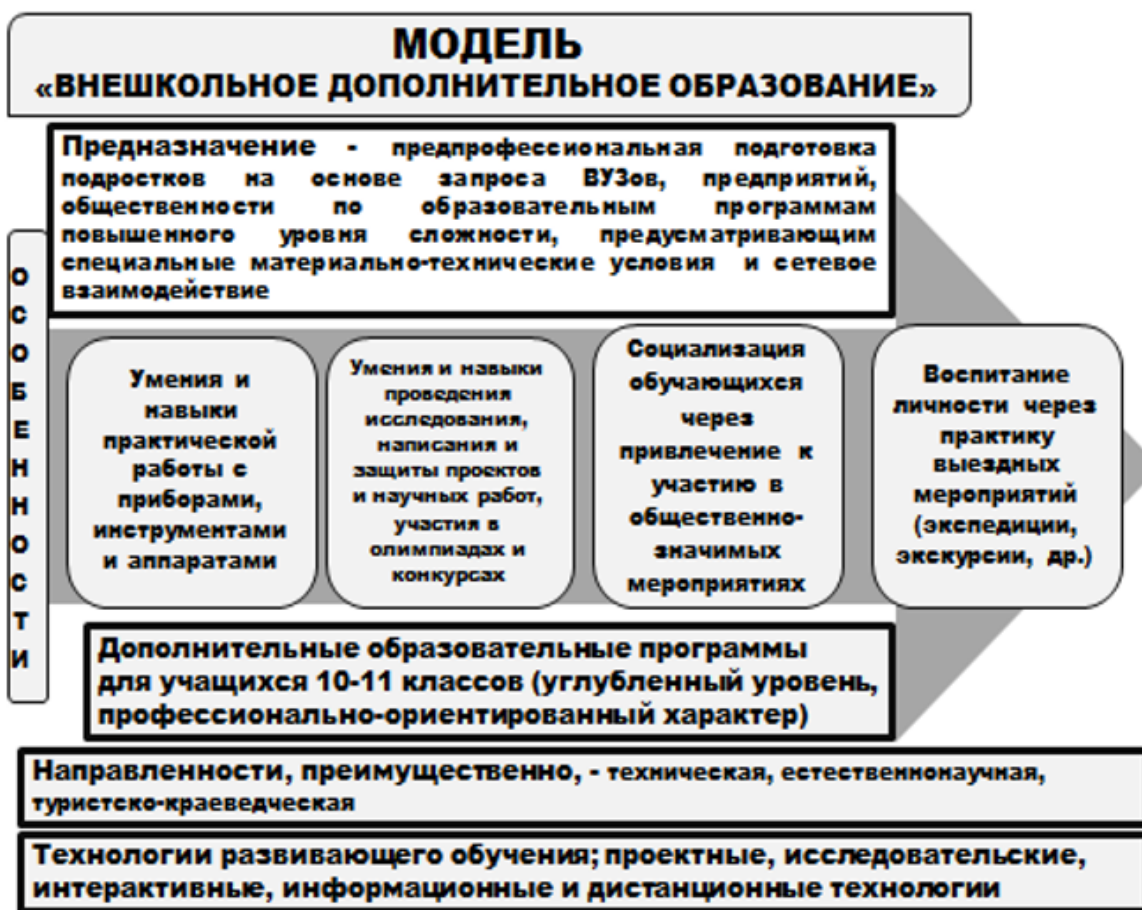
Рис. 2. Внешкольное дополнительное образование

Цель – создание современных центров интеллектуального и творческого развития детей на базе стабильных организаций дополнительного образования детей, имеющих развитую инфраструктуру.