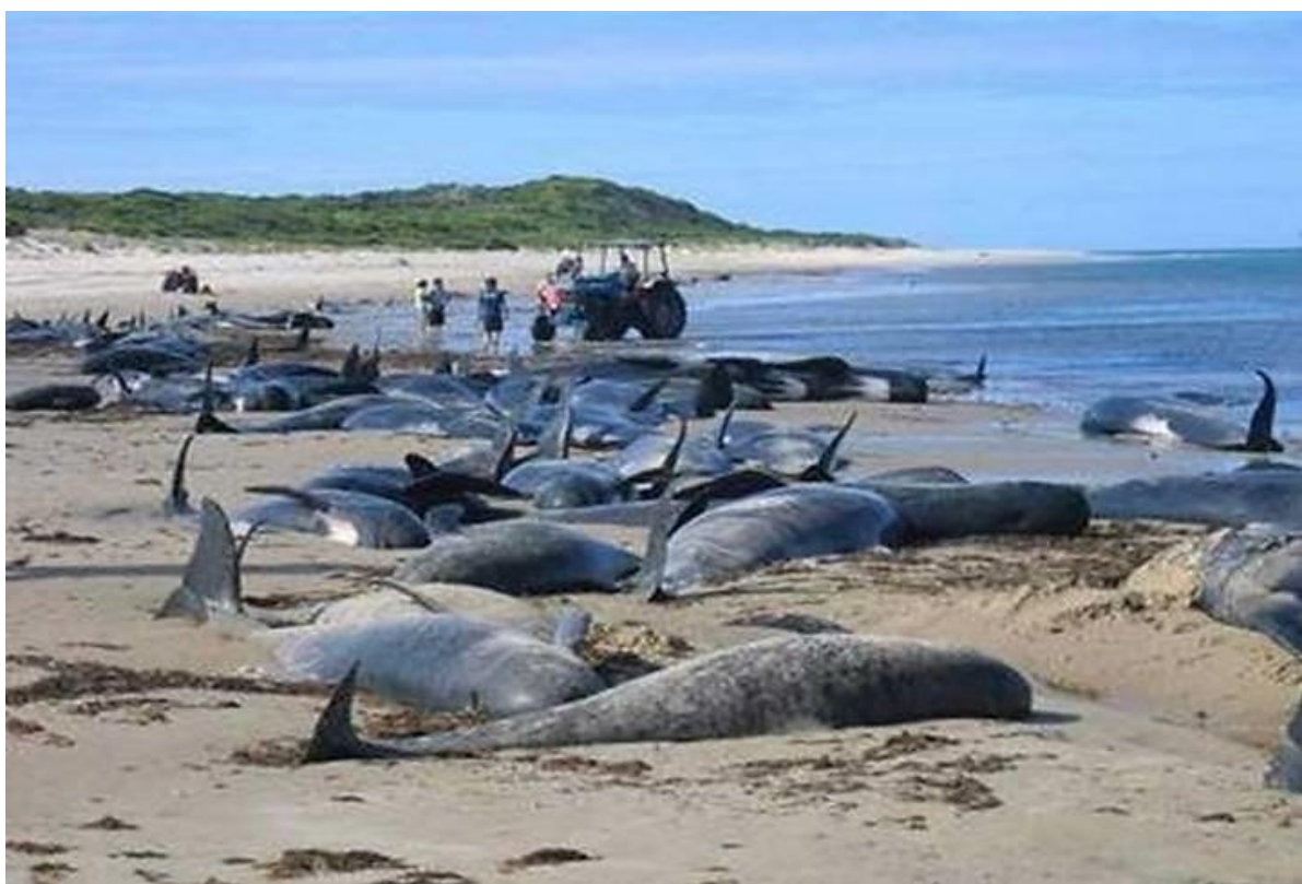
Рис. 3. Гибель животных