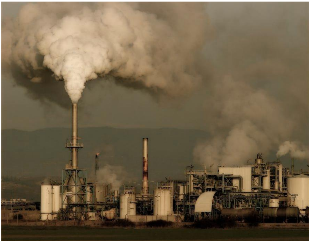
Рис.2. Заводы, загрязняющие воздух