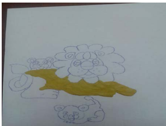
Теперь лепим траву