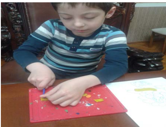
Вдавливаю пластилин в картину