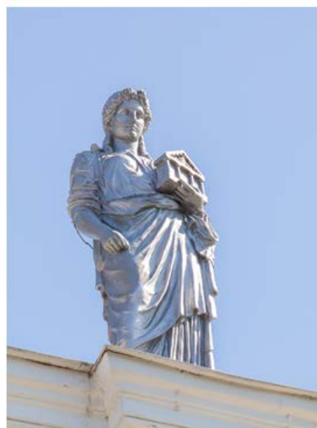
Рис. 5. Муза истории

В древнегреческой мифологии музы – дочери Гармонии, живущие на Парнасе богини – покровительницы искусств и наук. В руках у одной из них – лира и книга, в руках другой – храм, напоминающий Пантеон.