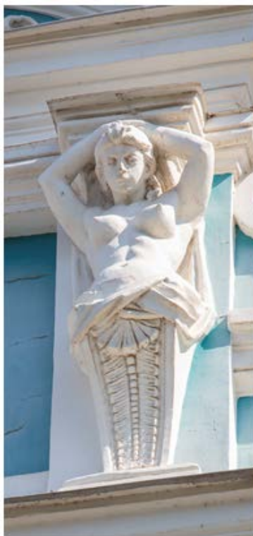
Рис. 4. Кариатиды

Далее среди обилия масок и символов, которые встречаются на фасаде дома, выделяются кариатиды (рис. 4).