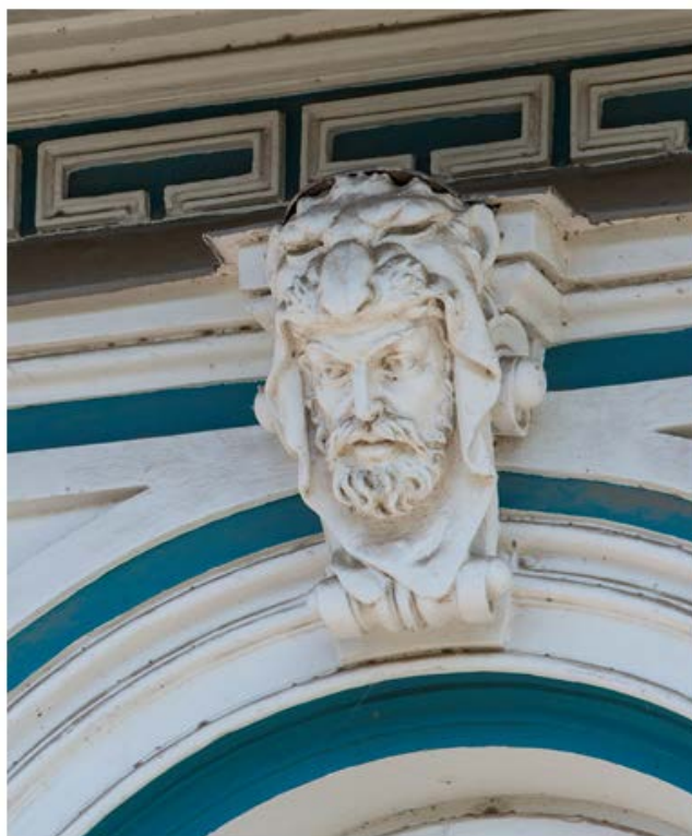
Рис. 2. Геракл