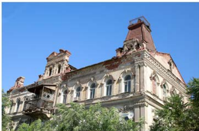
Рис. 9. Дом Саркисова

Действующими лицами «костюмированного бала» на фасаде дома Саркисова (ул. Красная Набережная, д.33; год постройки 1878 г., архитектор неизвестен) (рис. 9) является Пан – дух лесов и полей, и маска – лесная нимфа с мягко струящимися волосами, которая плавно переходит в растительный цветочный узор (рис. 10).