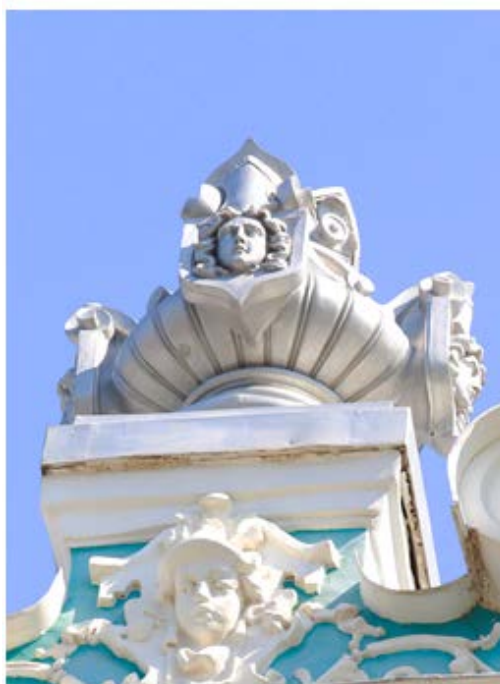
Рис. 3. Голова Медузы Горгоны и образ наследника дома

ребенка самого купца, наследника, что внушало надежду на могущество, процветание и достойное продолжение рода.