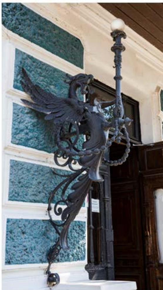
Рис. 6. Грифон

У входа в этот великолепный дворец находится чугунный светильник, выполненный в виде грифона. Грифон по мнению древних греков, фантастическое, мифическое существо, полуорел, полулев с длинным змеиным хвостом. В Древней Греции грифон посвящался Аполлону как животное, олицетворяющее солнце. И понятным становится, почему осветительный прибор связан с образом грифона (рис. 6).