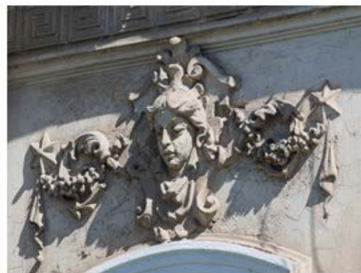
Рис. 10. Образ лесной нимфы

«Бородатый маскарон» удивительным образом напоминает картину Врубеля: как и на картине вид его устрашающий (рис. 11).