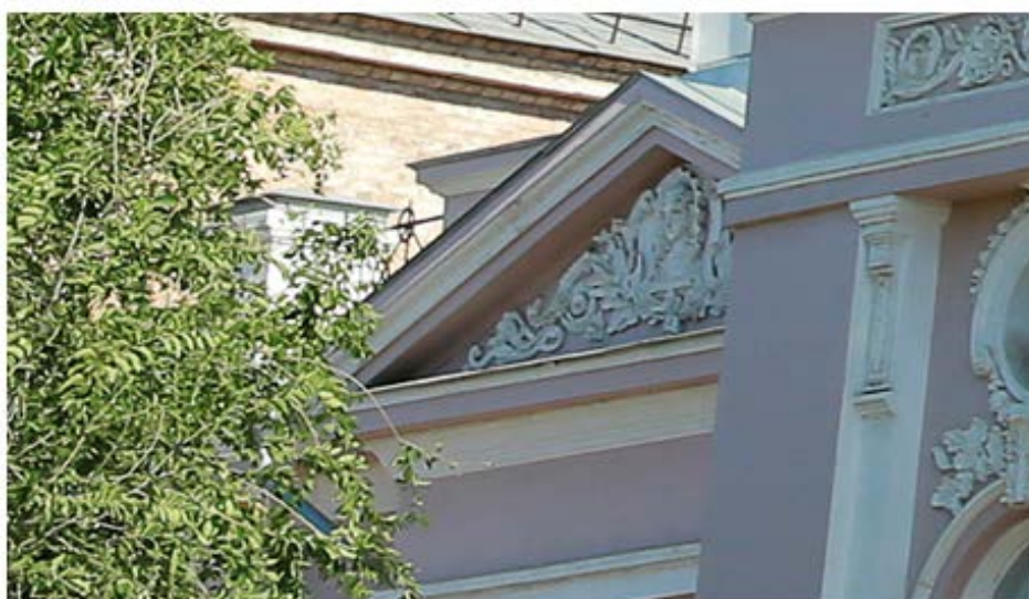
Рис. 8. Лавровые ветви на фасаде усадьбы