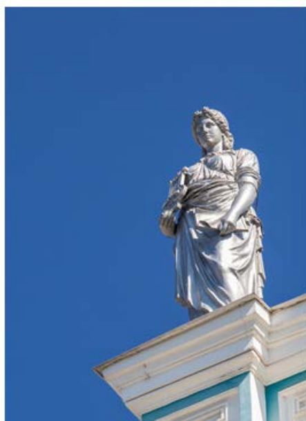
Рис. 4. Муза искусств

Кариатиды – это статуя женщины, введенная в архитектурную традицию древнегреческим зодчеством. Эта фигура заменяла собой колонну или пилястру и служила для поддержания частей здания, преимущественно с лицевой стороны. Фигуры богинь легко и изящно поддерживают аттический этаж губинского здания. У губинских кариатид руки вскинуты вверх, таким образом подчеркивается утонченность их хрупкой фигуры. И по контрасту – они напоминают титанов, поддерживающих тяжесть неба. Все это фотографировать мне было интересно, но очень сложно. И я в помощники взял Космачеву Лену, ученицу 5 класса гимназии №3 города Астрахани. Вдвоем нам удалось почти документально зафиксировать множество элементов на этом здании, связанных с древнегреческой мифологией. Особенно сложно было сфотографировать фигуры богинь, которые стоят на крыше. Для этого, по совету нашего руководителя, мы использовали длиннофокусный объектив на нашем фотоаппарате. Это помогло приблизить нам фигуры муз (рис. 4, 5).