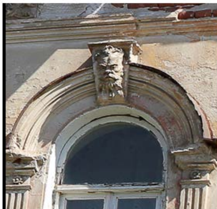
Рис. 11. «Бородатый маскарон»

«Бородатый маскарон» удивительным образом напоминает картину Врубеля: как и на картине вид его устрашающий (рис. 11).