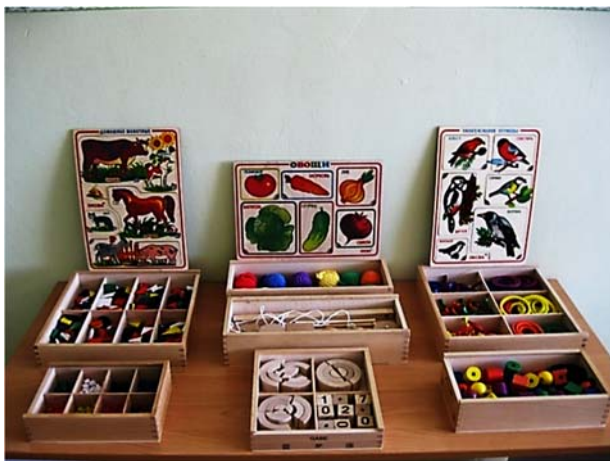
Рис. 2. Монтессори – материалы