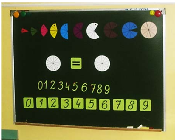
Рис. 3. Методика обучения математике детей коррекционных групп Наталии Пятибратовой «Учусь считать на 5»

Помимо этого, при обучении детей коррекционных групп математике используется методика Наталии Пятибратовой «Учусь считать на 5».