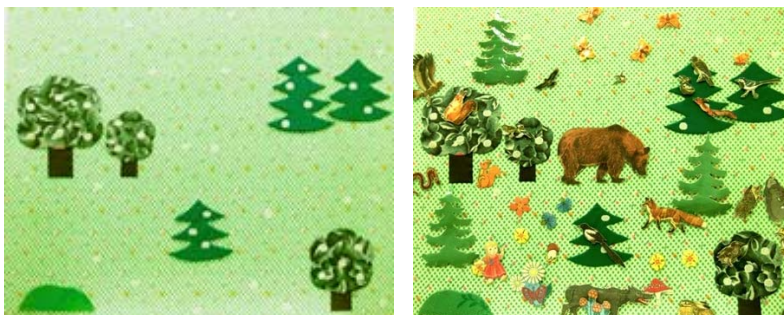
Рис. 1. Стенд-панно «Хорошо в лесу летом» (700 * 1000) без фигурок и с ними

У 2–3 летних детей мышление носит наглядно-действенный характер. Поэтому для ребенка очень важно в первую очередь тактильное обследование предмета, а уже затем рассматривание его, определение его частей, формы, цвета. Знакомя детей с дикими животными, мы опирались именно на учить особенности мышления детей раннего возраста. Наши демонстрационные стенды-панно – это оргалит, обтянутый тканью. На ткани пришиты отрезки текстильной застежки, куда дети самостоятельно прикрепляют фигурки, перед этим тщательно обследуя их. Для знакомства с дикими животными мы создали стенды-панно: «Хорошо в лесу летом» и «Лес зимой». Дети знакомятся с дикими животными, их поведением, внешним видом и образом питания в разное время года.