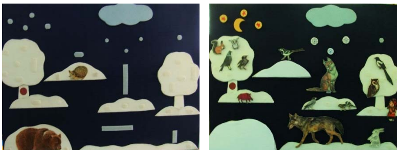
Рис. 2. Стенд-панно «Лес зимой» (600 * 900) без фигурок и с ними

Для каждого панно разработаны конспекты занятий, где присутствует любопытная девочка Маша, которая хочет все знать и задает много разных вопросов, на которые воспитатель отвечает вместе с детьми.