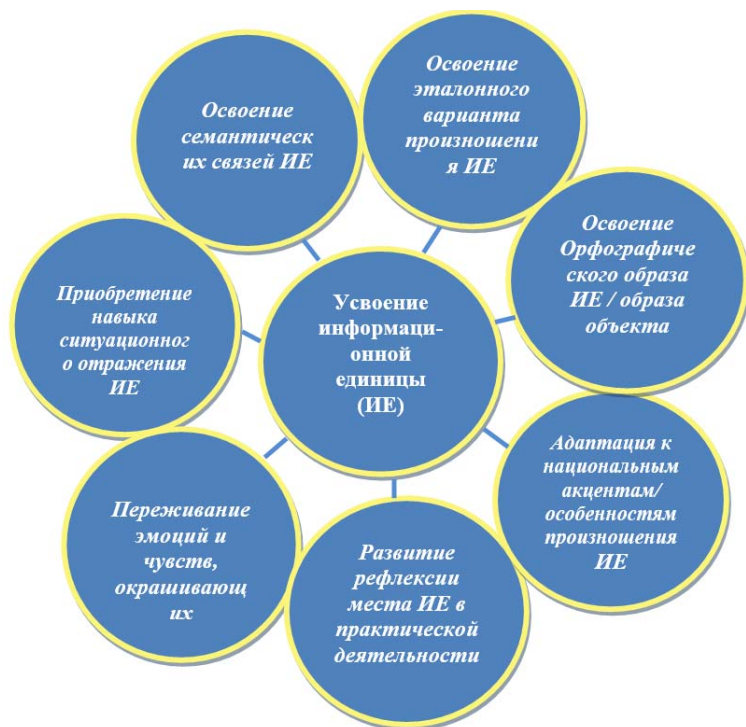
Рис. 2. Параметры усвоения иноязычной информационной единицы

специалиста: названия новых неизучавшихся ранее материальных объектов, лингвистические единицы, знаковые информационные единицы, формулы, рисунки изучаемых объектов, дефиниции новых объектов или понятий, формулировки законов, правила, инструкции и т.п. При отборе и структурировании содержания учебного материала для пакетов компьютерных программ первой ступени ИОМ группируются конкретные ИЕ типовой задачи труда специалиста с учетом возможностей их реализации на техническом средстве обратной связи: