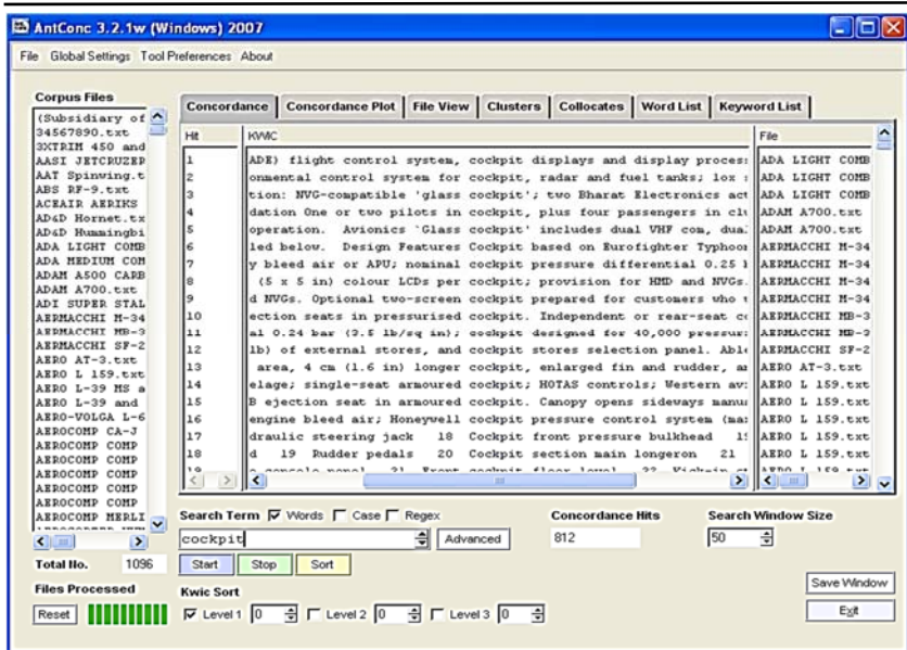
Рис. 3. Окно программы AntConc 3.1.8w с конкордансом слова cockpit

Программа-конкордансер является промежуточным элементом между корпусом и пользователем, поскольку она позволяет извлекать необходимую информацию из корпуса с помощью запросов. На настоящий момент имеется немало таких программ, например, Text Analyst, Фильтратор, Texter, Ant Conk 3.1, Manatee (Bonito), IMS Corpus Workbench (CQP), XAIRA, LEXA, Virtual Corpus Manager (VMC), EXMARaLDA Corpus-Manager (Co-Ma) и т.д.