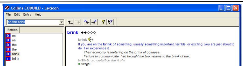
Рис. 4. Словарная статья из словаря CollinsCOBUILD Для фразы on the brink of

Однако анализ конкорданса для фразы on the brink of , составленного с помощью BNC, указывает на то, что данное выражение в 20 % случаев имеет нейтральное или положительное значение. Тем не менее, это не находит отражение в словарной статье. Поэтому корпус текстов является незаменимым средством для проведения дополнительных исследований, особенно при работе с узкоспециализированными техническими текстами [68].