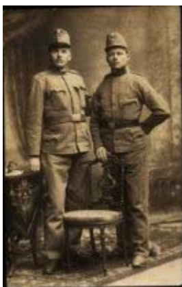
Рис. 5. Австрийские солдаты в 1918 г. Ново-Николаевскъ