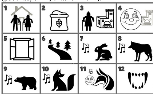
Рис 3. Сказка «Колобок»

После того, как дети овладели мнемодорожкой, педагог включает в свою работу мнемотаблицу. Мнемотаблица – это целая схема, в которую заложен текст (рассказ, стих, сказка и т. п.).