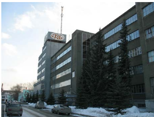
Рис. 1. Здание заводоуправления УЗТМ

Выполняя задания госбезопасности, с 15 мая 1935 года Николай Кузнецов работает в КБ (конструкторское бюро) завода Уралмаш (Уральский завод тяжелого машиностроения (УЗТМ)). Ему был присвоен оперативный псевдоним «Колонист».