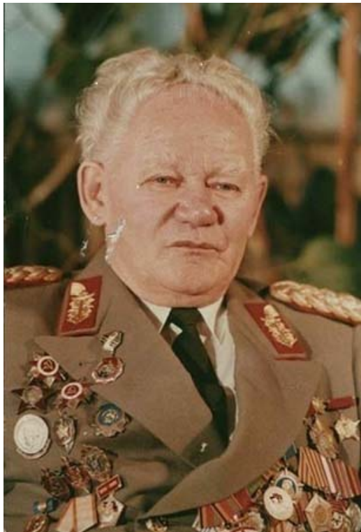
Рис. 10. Карл Кляйнюг

Карл Кляйнюг после войны вернется на родину и будет участвовать в создании спецслужб Германской Демократической Республики. Станет генералом, начальником Главного управления МГБ ГДР, отвечающего за Национальную народную армию и пограничные войска. В 1981 году выйдет в отставку. Воссоединение Германии антифашист и интернационалист, советский разведчик Карл Кляйнюг, не признает, откажется получать пенсию от властей ФРГ и будет вывешивать перед своим домом флаг ГДР.