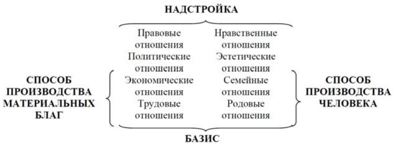
Рис. 2. Базисно-надстроечная модель социума

Базисно-надстроечная детерминация присутствует и в духовной жизни. Обыденное представление о том, что продукт сам по себе считается товаром, «образует базис для фетишизма политико-экономов» 425 . Отрыв от эмпирического базиса порождает иллюзии философии, придает ей характер идеологического, спекулятивного выражения действительности 426 .