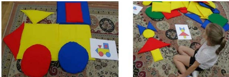
Рис. 3. Игра «Геометрический конструктор»

Одним из методов развития познавательных интересов и творческой активности детей старшего дошкольного возраста является моделирование, поскольку их мышление отличается предметной образностью и наглядной конкретностью. Моделирование в игре «Геометрический конструктор» оказывает положительное влияние на интеллектуальное развитие детей. С помощью пространственных и графических моделей относительно легко и быстро совершенствуется ориентировочная деятельность. (рис. 3).