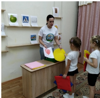
Рис. 1. Игра «Магазин»

фигуры, например за треугольник можно купить ёлку, пирамидку; за квадрат телевизор, шахматную доску; за прямоугольник чемодан или новую дверь в квартиру. В зависимости от возраста условия могут усложняться (выбрать товар по двум свойствам (форма, цвет)) (рис. 1).