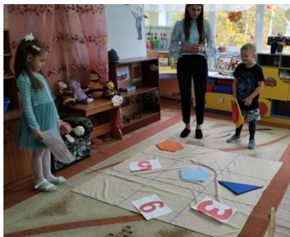
Рис. 2. Игра «Крестики-нолики наоборот»

Формировать и развивать у детей интерес, пытливый ум, помогает нам технология развития критического мышления [3, с. 162], одним из методов которой является игра «Крестики-нолики наоборот» (рис. 2).