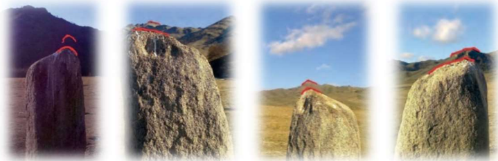
Рис. 2. 1. Имчек хая (восток). 2. Позик пиль (юг). 3. Сун-дух хая (запад) 4. Улуг хая (север)

Находясь рядом с изваянием и установив по компасу стороны света, определяли, какая из горных вершин могла служить «частью вселенной». Таковых оказалось четыре.