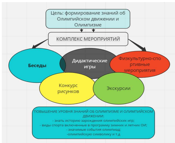
Рис. 1. Комплекс мероприятий, направленный на формирование знаний об Олимпийской движении и Олимпизме

– беседы на темы: «Возникновение Олимпийских игр», «Олимпийская символика и традиции», «Знаменитые олимпийцы» и другие, всего было проведено 14 таких мероприятий, которые мы реализовали во время проведения занятий по физическому воспитанию;